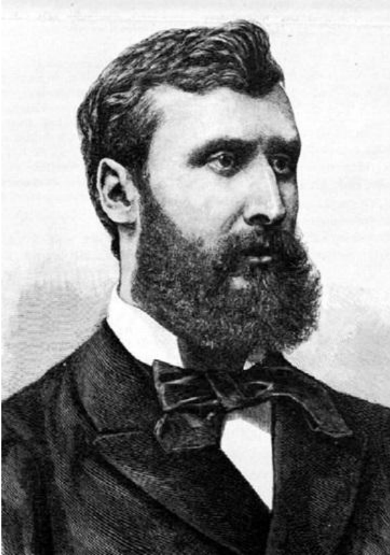
Лоран Этвёш (1848 — 1919), Известный венгерский физик, президент Венгерского Физико- Математического Общества