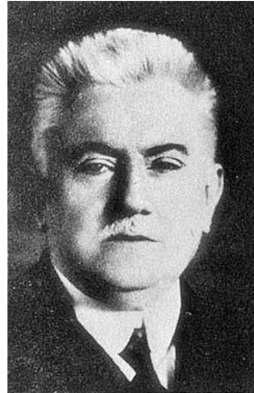
Йозеф Кюршак (1864 — 1933), Венгерский математик и педагог, организатор математических соревнований