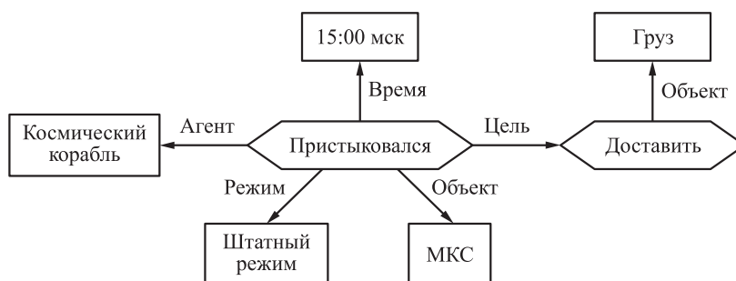
Рис. 2 Пример семантической сети, описывающей событие доставки груза на МКС