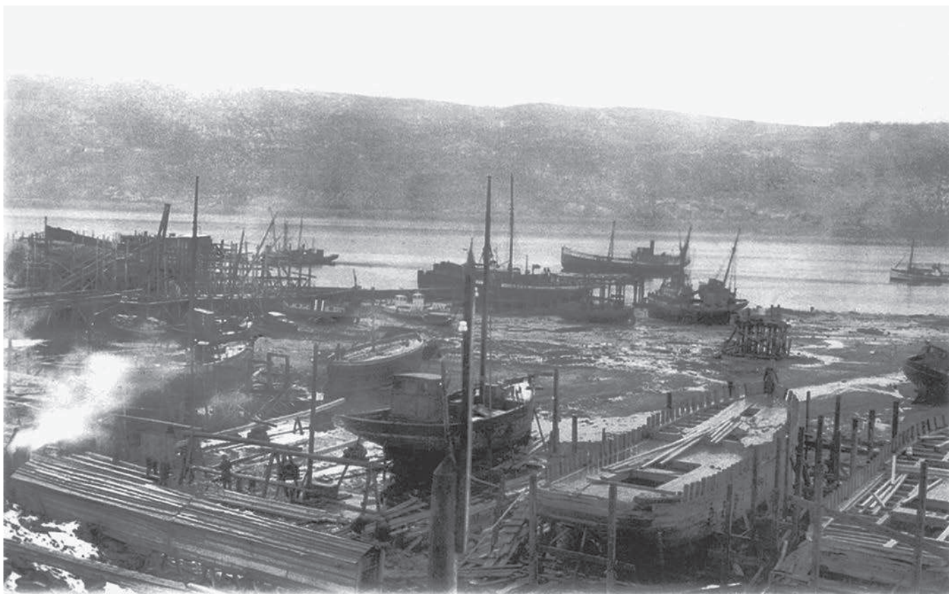
Верфь деревянного судостроения

§ 3. С завоеванием древнего мира римлянами отвле-